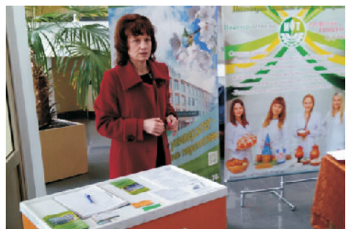
Факультет государственной подготовки и профориентационной работы

Профориентационная работа, проведенная агитбригадами Гродненского государственного аграрного университета, безусловно, в скором времени принесет свои плоды. Для дальнейшего продвижения и популяризации нашего университета среди учащихся выпускных классов учреждений образования Гродненской области и крупных районных центров такие профориентационные мероприятия просто необходимы.