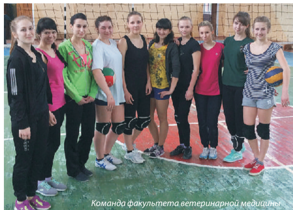
Команда факультета ветеринарной медицины