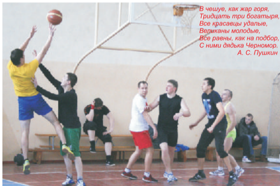
В чешуе, как жар горя, Трицать три богатыря, Все красавцы удалые, Веряны молодью, Все равны, как на подбор, С ними бьются Черномор, А. С. Пушкин