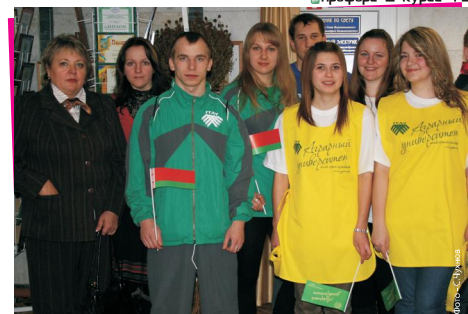
Начальник отдела по воспитательной работе с молодёжью ГМЛитиса из студенческим активом университета на Открытии спортивно-художественного праздника